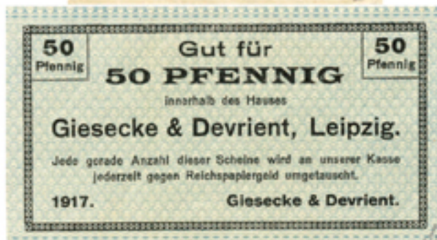
Abb. 43i, k: 5- und 50-Pf-Gutschein von Giesecke & Devrient, Leipzig, 1917.*