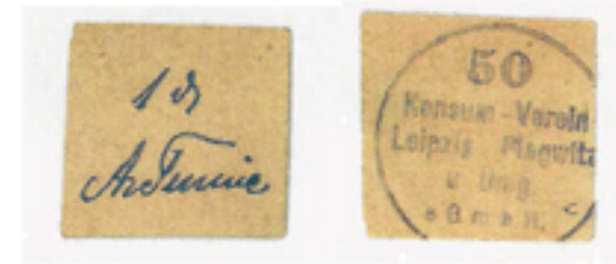
Abb. 43c: Restzettel des Konsum-Vereins L.-Plagwitz, Vs. u. Rs.*